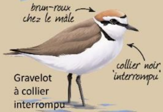
Gravelot à collier interrompu